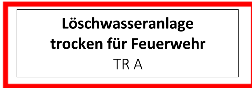
Abb.2: Hinweis Entnahmeeinrichtung

Eine Entnahmeeinrichtung ist hierbei in jedem oberirdischen Geschoss, oberhalb des Erdgeschosses sowie in allen unterirdischen Geschossen anzuordnen. An jeder Entnahmestelle ist die Kennzeichnung „Löschwasserleitung trocken (nass) für (die) Feuerwehr“ anzubringen sowie auf die Zugehörigkeit zu einer bestimmten Einspeisestelle hinzuweisen (s. Abb. 2).