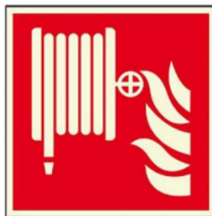
Abb.3: Kennzeichnung „Löschschlauch“

Wandhydranten des Typ F und Typ S sind mit dem Piktogramm „Löschschlauch“ zu versehen (s. Abb 3). Das Piktogramm ist gemäß den Vorgaben nach E DIN 4844-2 bzw. DIN EN ISO 7010, in der Größe von 200 mm x 300 mm anzubringen.