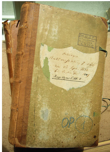
Amtsversammlungsprotokolle des Oberamts Öhringen aus dem 19. Jahrhundert

Gleichzeitig fördert das Kreisarchiv die Erforschung der Kreis- und Heimatgeschichte. Auch die historische Bildungsarbeit und die Vorbereitung von kulturhistorischen Veranstaltungen sind wichtige Aufgaben.