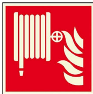
Abb.3: Kennzeichnung „Löschschlauch“

Wandhydranten des Typ F und Typ S sind mit dem Piktogramm „Löschschlauch“ zu versehen (s. Abb 3). Das Piktogramm ist gemäß den Vorgaben nach E DIN 4844-2 bzw. DIN EN ISO 7010, in der Größe von 200 mm x 300 mm anzubringen.